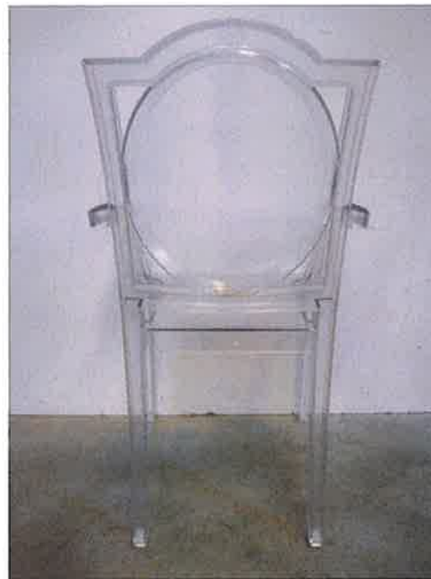
Vista da dietro