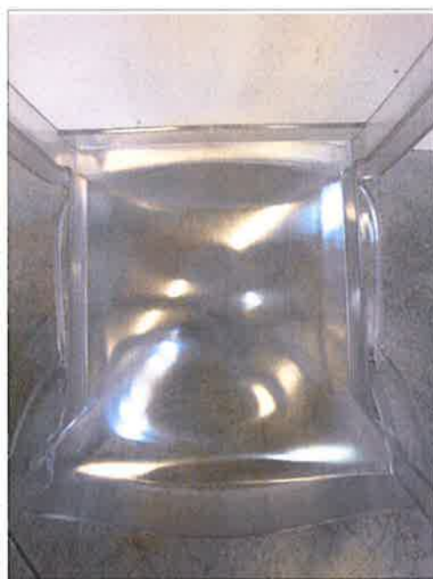
Vista da sotto