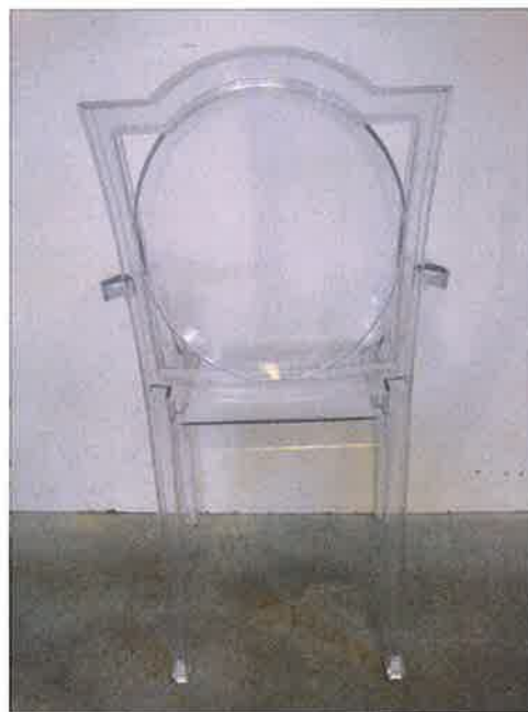
Vista da dietro