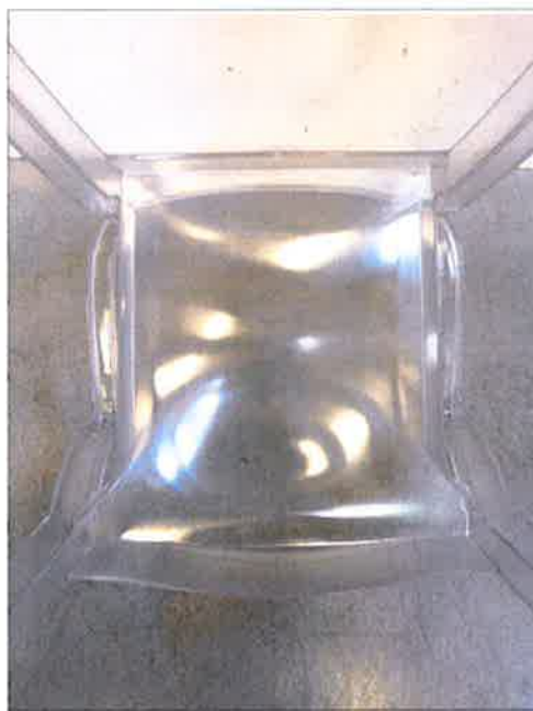
Vista da sotto